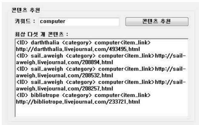
(그림 4) 콘텐츠 추천 인터페이스

제안한 시스템의 FOAF 및 RSS 수집과 소셜 네트워크 구축은 (그림 3)과 같이 사용자가 입력한 아이디를 이용하여 FOAF 와 RSS 를 수집한 후 사용자에게 추천하는 기존 그래프 기반 콘텐츠 추천 방법과 달리 다양하고 범용적인 콘텐츠를 사용자에게 추천할 수 있다.