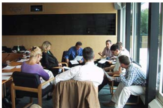
Participants du MEMOS V dans un travail de groupe au siège du CIO.

T he MEMOS programme consists of three one-week residential modules, each lasting 6 days, scheduled over twelve months together with a personal project. Each module takes place in a different city and is placed under the joint responsibility of a scholar and of a professional. In addition, the participants undertake a study project concerning the performance management of a sport organisation, in principle the one in which they are active. The last two days of each module are dedicated to the coaching of the participants on their projects by their tutors. The defense and public presentation of these projects, as well as the awarding of the degrees take place at the Olympic Museum in Lausanne, during a fourth module.