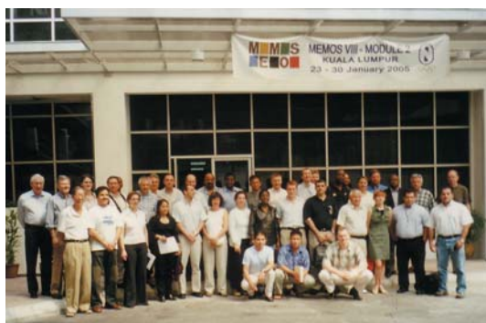
Les enseignants et participants du MEMOS VIII provenant de 30 pays, au siège du Comité olympique de Malaisie à Kuala Lumpur.